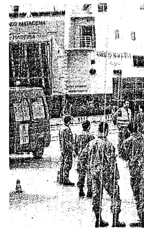
Le operazioni di sbarco de

Si sono concluse, al r "Marconi", le operazioni di sbarco dei mezzi della Brigata "Aosta" utilizzati in Kosovo nell'ambito della missione di pace fuori area che ha visto i militari siciliani impegnati per sei mesi.